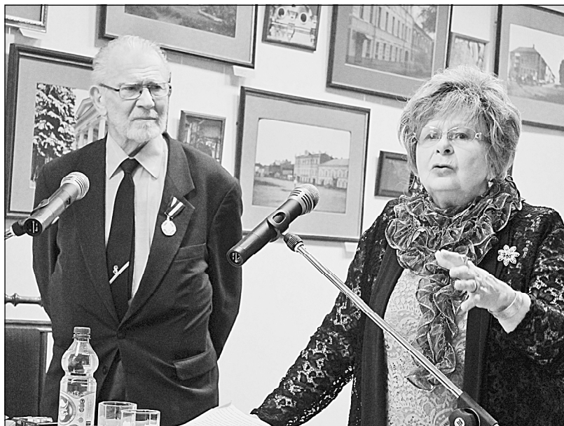
Они приезжают в Боровичи, подчиняясь зову предков...