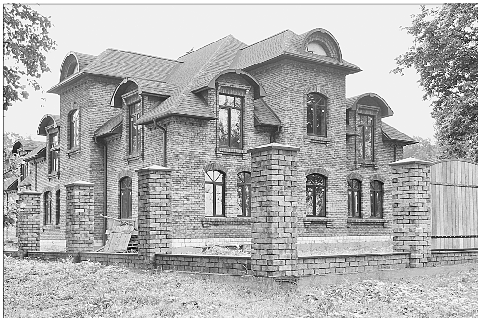
Новый дом на углу набережной Октябрьской революции и Порожской