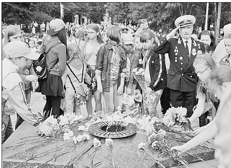
Поклониться павшим к Вечному огню пришли и стар и млад