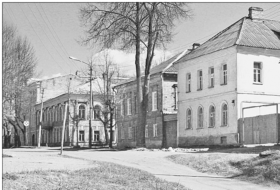
Старинный уголок Боровичей – угол улиц Майкова и 9 Января